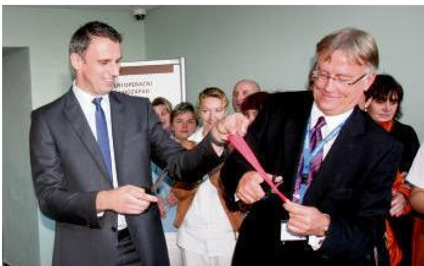
OPERAČNÍ PAVILONY. K otevření došlo v roce 2013. Přestřižení pásky se zúčastnil také jihočeský hejtman Jiří Zimola. Pro něj je strakonická nemocnice vždy zárukou kvalitní péče a plánování do budoucnosti.

To potvrzuje i ředitel nemocnice Tomáš Fiala. „Péče byla roztržena. Měli jsme dvě operační centra, jedno menší na gynekologii, druhé